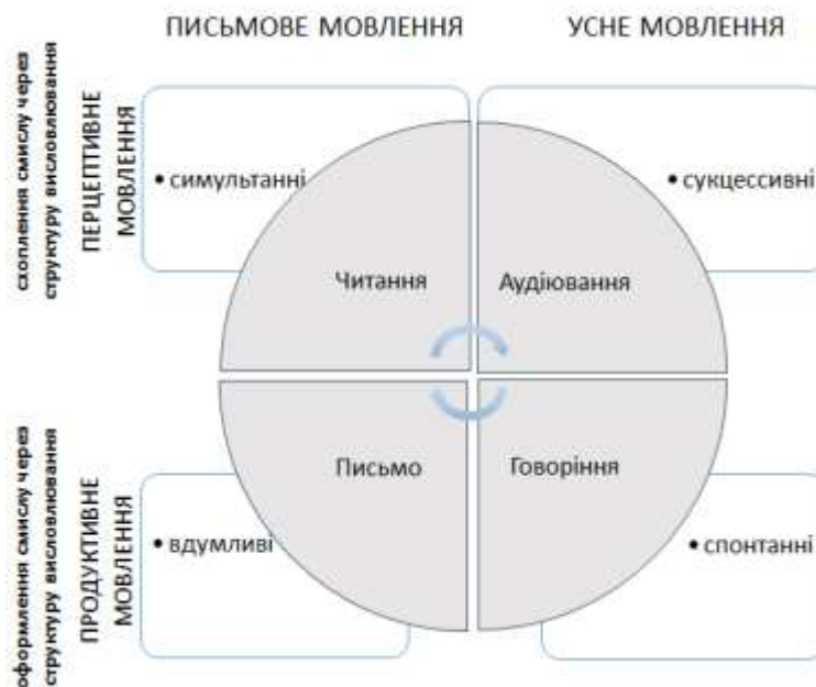
Рис. 1 Процесуальні характеристики розумових дій з породження і сприйняття смислу висловлювання в залежності від виду мовленнєвої діяльності.

Разом з тим результати аналізу досліджень, як у зарубіжній, так і вітчизняній традиції, дозволили значно розширити системне уявлення про проблему в історичному континуумі розвитку наукової думки. Визначення розумових дій з породження і сприйняття мовленнєвого висловлювання базується на уявленні про їх обумовленість смисловою структурою висловлювання. Отже, під розумовими діями з породження і сприйняття мовленнєвого висловлювання слід розуміти дії, здійснювані людиною у внутрішньому плані і спрямовані на вилучення та передачу сенсу, вираженого в межах смислової структури мовленнєвого висловлювання в усній або письмовій формі (рис. 1). Породження іншомовного висловлювання – суцесивне формування мовленнєвого висловлювання у смислових одиницях базової структури висловлювання, що відповідають комунікативній меті. Сприйняття іншомовного висловлювання – симультанне схоплювання мовленнєвого висловлювання в смислових одиницях базової структури висловлювання, що відповідають комунікативній меті.