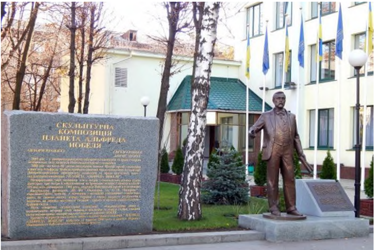
Пам'ятник А. Нобелю на території вищого навчального закладу «Університет ім. Альфреда Нобеля», Україна, м. Дніпро

Голова правління Нобелівського Фонду (1993-2005 гг.) Бенгт Самуельсон