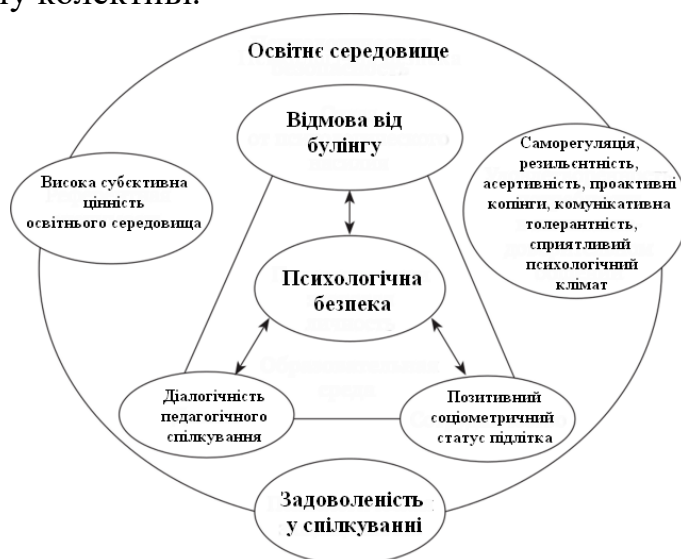
Рис. 4 Психологічна модель психологічної безпеки освітнього середовища основної школи.

педагогічного спілкування, достатньо високий соціометричний статус кожного підлітка у шкільному колективі.