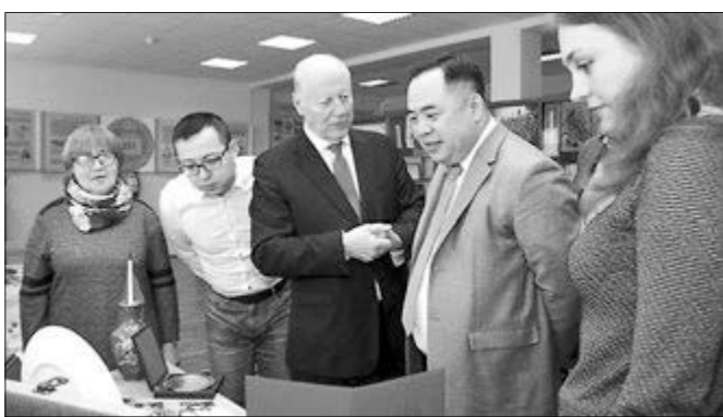
На екскурсії в Музеї історії університету з ректором І.Ф. Прокопенком

Учасники заходу зазначили, що українці та китайці зацікавлені в налагодженні тісних зв'язків в освітній та науковій сферах. Про це яскраво засвідчила тепла та приємна атмосфера, що панувала на цьому святі.