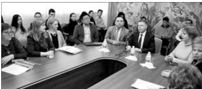
Під час ознайомлення з науковою діяльністю аспірантів КНР у ХНПУ імені Г.С. Сковороди